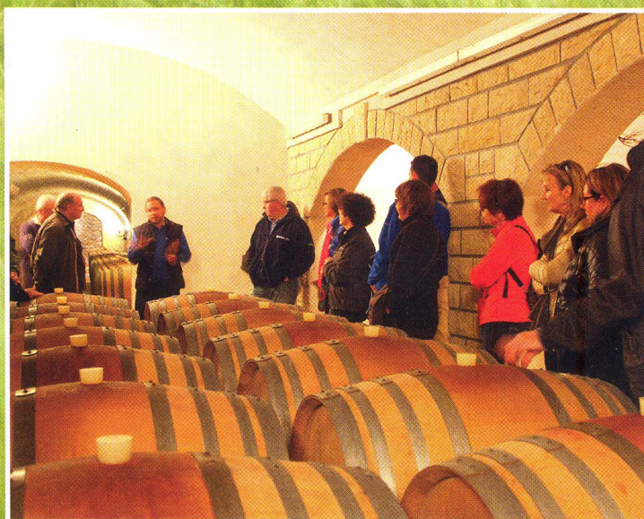
Les visites de cave, comme ici à Sancerre, et la découverte des produits régionaux sont incontournables dans les sorties du Club 4x4 Mercedes.